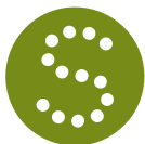
Tabulka 4 Jednání Úzkého vedení Svazu