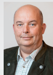
Miroslav Toman, ministr zemědělství

soutěž o nejlepšího zemědělského hospodáře pořádaná pod záštitou ministra zemědělství