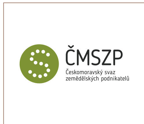
Nové logo svazu.

Jak se vyznat v systému Společné zemědělské politiky a Programu rozvoje venkova? Na co má farmář nárok a jakým způsobem může své hospodaření provozovat? Jak vytvořit udržitelný systém v kombinaci produkce, výroby a doplňkových činností ve venkovském prostoru včetně spolupráce? Jak využít dotační prostředky? Jak náročné je ekologické hospodaření a jaký význam má welfare v praxi?