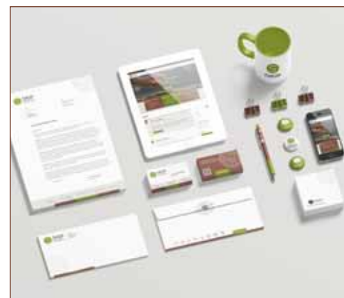
Nová korporátní grafika svazu.

Nejen na tyto základní otázky by měl odpovědět výstup projektu ČMSZP, v jehož řadách je mnoho farmářů, kteří dlouhodobě hospodaří a mají zkušenosti, s nimiž se mohou a chtějí podělit. Cílem není pouze sesbírat informace, ale hlavně předávat pestitelům a chovatelům, začínajícím či budoucím farmářům a také veřejnosti příklady dobré praxe hospodaření farmářů v horských a podhorských oblastech se zaměřením na udržitelné hospodaření – modernizaci, finalizaci a diverzifikaci.