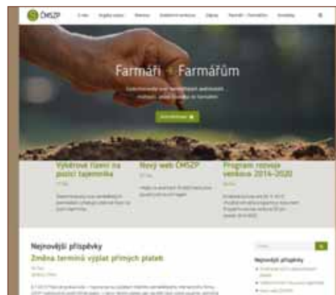
Nový design webových stránek svazu.